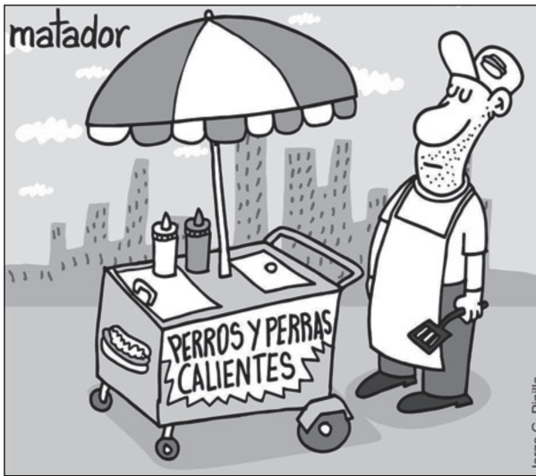
Imagen 2. Perros y perras calientes