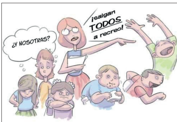
Imagen 3. Salgan todos al receso