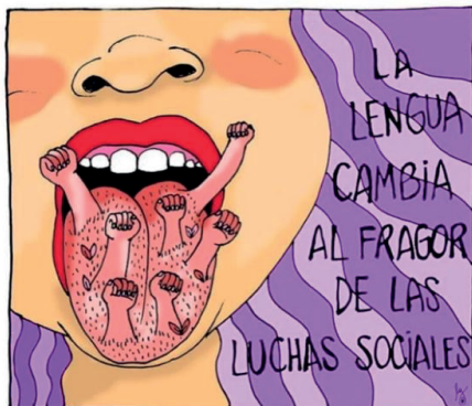
Imagen 1. La lengua cambia al fragor de las luchas sociales