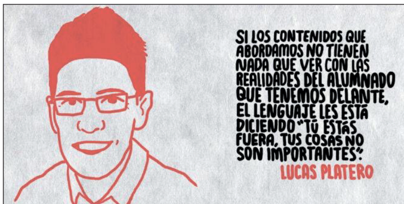
Imagen 6. Lenguaje y educación